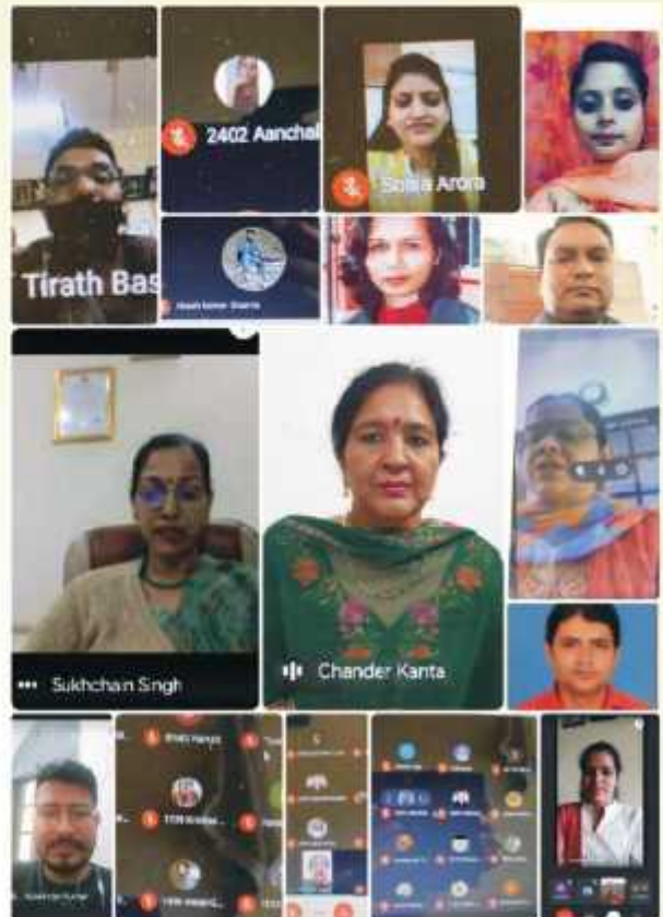
ਕਾਲਜ ਦੇ ਹਿਸਟਰੀ ਵਿਭਾਗ ਵੱਲੋਂ ਭਾਰਤ ਦੀ ਆਜ਼ਾਦੀ ਦੀ 75ਵੀਂ ਵਰੇਗੰਡ ਮੌਕੇ ਵੈਬੀਨਾਰ ਕਰਵਾਇਆ।