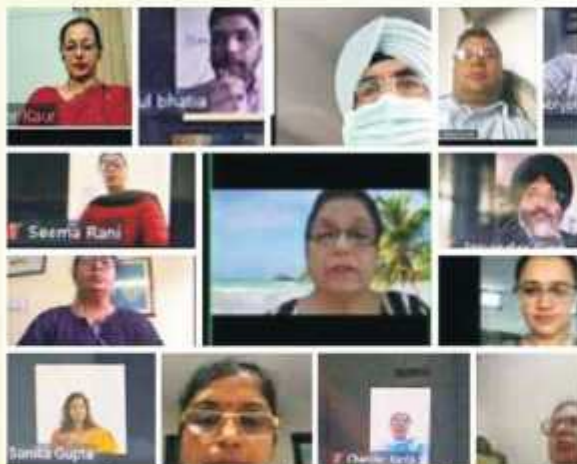
ਕਾਲਜ ਦੇ ਸਾਇੰਸ ਵਿਭਾਗ ਵੱਲੋਂ ‘ਲਾਕਡਾਊਨ ਤੋਂ ਬਾਅਦ ਦੇ ਜੀਵਨ ਦੇ ਰਹਿਣ ਸਹਿਣ’ ਦੇ ਵਿਸ਼ੇ ਉੱਤੇ ਵੈਬੀਨਾਰ ਕਰਵਾਇਆ।