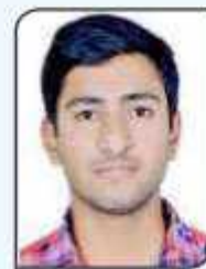
ਰਾਜਨ ਕਲਾਸ ਬੀ ਐਸਸੀ. ਕੰਪਿਊਟਰ ਸਾਇੰਸ ਸੈਮੇਸਟਰ ਛੇਵਾਂ ਨੇ ਜੀ ਟੀ. ਗਰੁੱਪ ਆਫ ਇੰਸਟੀਚਿਊਟ ਸਲੱਬ ਵਿਖੇ ਹੋਏ ਅੰਤਰ-ਕਾਲਜ ਲੋਕ ਗੀਤ ਮੁਕਾਬਲੇ ਅਤੇ ਹਿੰਦੂ ਕੋਨਿਆ ਕਾਲਜ ਕਪੂਰਥਲਾ ਵਿਖੇ ਹੋਏ (ਉਮੰਗ-2018) ਅੰਤਰ-ਕਾਲਜ ਲੋਕ ਗੀਤ ਮੁਕਾਬਲੇ ਵਿੱਚ ਦੂਜਾ ਸਥਾਨ ਪ੍ਰਾਪਤ ਕੀਤਾ