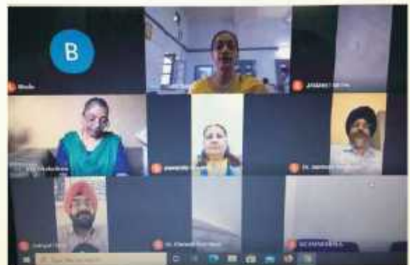
ਕਾਲਜ ਦੇ ਹਿਸਟਰੀ ਵਿਭਾਗ ਵੱਲੋਂ ਗੁਰੂ ਤੇਗ ਬਹਾਦਰ ਜੀ ਦੇ 400ਵੇਂ ਪ੍ਰਕਾਸ਼ ਪੂਰਬ ਦੇ ਮੌਕੇ “ਗੁਰੂ ਤੇਗ ਬਹਾਦਰ ਜੀ-ਜੀਵਨ ਅਤੇ ਵਿਚਾਰ” ਵਿਸ਼ੇ ਤੇ ਵੈਬੀਨਾਰ ਕਰਵਾਇਆ।