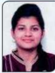
ਦਾਖਨੀ ਬਰਮਾ ਕਲਾਸ ਥੀ ਐਸਜੀ. ਮੈਡੀਕਲ ਸੰਸਕਰ ਚੇਵਾਂ ਗੁਰੂ ਨਾਨਕ ਦੇਵ ਯੂਨੀਵਰਸਿਟੀ ਦੀ ਮੈਰਿਟ ਲਿਸਟ ਵਿੱਚ ਨੌਵਾਂ ਸਥਾਨ ਪ੍ਰਾਪਤ ਕੀਤਾ