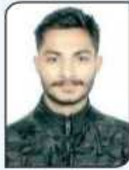
ਸਕਾਨ, ਬੀ ਏ. ਸਮੇਸਟਰ ਦੂਸਰਾ, ਆਨ ਦੀ ਸਪਾਟ ਪੇਟਿੰਗ ਮੁਕਾਬਲੇ ਵਿੱਚ ਜੇਨਲ ਯੂਥ ਫੈਸਟੀਵਲ ਵਿੱਚ ਪਹਿਲਾ ਸਥਾਨ ਹਾਸਲ ਕੀਤਾ।