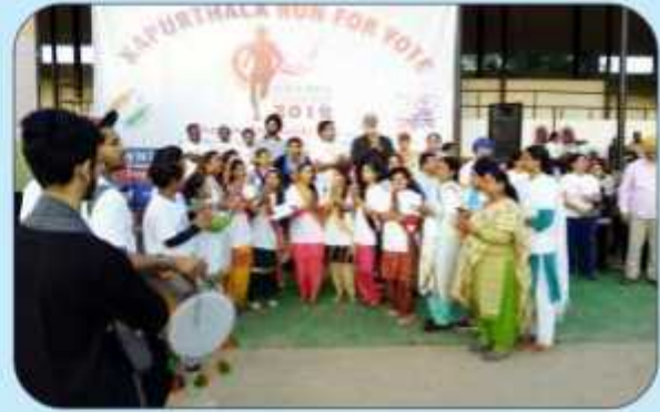
ਚਿਲ੍ਹਾ ਪ੍ਰਸ਼ਾਸਨ ਵਲੋਂ ਆਯੋਜਿਤ ਕੀਤੀ ਗਈ ਮਿੰਨੀ ਮੈਰਾਥਨ "ਕਪੂਰਥਲਾ ਰਨ ਫਾਰ ਯੁੱਥ" ਵਿੱਚ ਭਾਗ ਲੈਂਦੇ ਹੋਏ ਕਾਲਜ ਦੇ ਸਟਾਫ਼ ਮੈਂਬਰਜ਼ ਅਤੇ ਵਿਦਿਆਰਥੀ