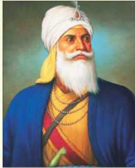
ਨਵਾਬ ਜੱਸਾ ਸਿੰਘ ਆਹਲੂਵਾਲੀਆ ਕਾਲਜ ਦਾ ਪਿਛੋਕੜ

ਪੰਜਾਬ ਦੀ ਇਸ ਇਤਿਹਾਸਕ ਅਤੇ ਗੌਰਵਮਈ ਸੰਸਥਾ ਦਾ ਆਰੰਭ 1856 ਈ. ਵਿੱਚ ਮਹਾਰਾਜਾ ਰਣਧੀਰ ਸਿੰਘ ਨੇ ਸੰਸਕ੍ਰਿਤ ਵਿਦਿਆਲਯਾ ਵਜੋਂ ਕੀਤਾ ਅਤੇ ਬਾਅਦ ਵਿੱਚ ਮਹਾਰਾਜਾ ਜਗਤਜੀਤ ਸਿੰਘ ਨੇ 1896 ਈ. ਵਿੱਚ ਇਸ ਨੂੰ ਇੰਟਰਮੀਡੀਏਟ ਕਾਲਜ ਤੇ 1945 ਈ. ਵਿੱਚ ਡਿਗਰੀ ਕਾਲਜ ਦਾ ਰੂਪ ਦਿੱਤਾ। ਇਸ ਕਾਲਜ ਵਿੱਚ 1968 ਈ. ਵਿੱਚ ਅੰਗਰੇਜ਼ੀ ਤੇ 1976 ਈ. ਵਿੱਚ ਅਰਥ ਸ਼ਾਸਤਰ ਦੀਆਂ ਐਮ.ਏ. ਕਲਾਸਾਂ, 1986 ਈ. ਤੋਂ ਬੀ.ਕਾਮ., 1991 ਈ. ਤੋਂ ਬੀ.ਐਸਸੀ. (ਮੈਡੀਕਲ) ਅਤੇ 2004 ਈ. ਤੋਂ ਐਮ.ਕਾਮ. ਦੀਆਂ ਕਲਾਸਾਂ ਆਰੰਭ ਹੋਈਆਂ। ਲੰਬੀ ਅਤੇ ਜ਼ਰਖੇਜ ਪਰੰਪਰਾ ਵਾਲੇ ਇਸ ਕਾਲਜ ਨੇ ਕੌਮੀ ਅਤੇ ਕੌਮਾਂਤਰੀ ਪੱਧਰ ਦੇ ਅਨੇਕਾਂ ਖਿਡਾਰੀ, ਸਿਆਸਤਦਾਨ, ਸਾਹਿੱਤਕਾਰ, ਸਮਾਜ ਸੇਵੀ ਅਤੇ ਪ੍ਰਸ਼ਾਸਕ ਪੈਦਾ ਕੀਤੇ ਹਨ। ਕਾਲਜ ਵਿੱਚ 1953 ਈ. ਵਿੱਚ ਲੜਕੀਆਂ ਲਈ ਹੋਮ-ਸਾਇੰਸ ਵਿਸ਼ੇ ਦਾ ਆਰੰਭ ਕੀਤਾ ਗਿਆ ਅਤੇ “ਦੀ ਨਿਊ ਮਹਾਤਮਾ ਗਾਂਧੀ ਮੈਮੋਰੀਅਲ ਗਰਲਜ਼ ਵਿੰਗ” ਉਸਾਰਿਆ ਗਿਆ।