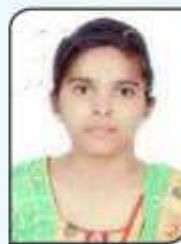
ਗੁਜਨ ਕਲਾਸ ਬੀ ਏ. ਸੈਮੇਸਟਰ ਛੇਵਾਂ ਨੇ ਹਿੰਦੂ ਕੋਨਿਆ ਕਾਲਜ ਕਪੂਰਥਲਾ ਵਿਖੇ ਹੋਏ (ਉਮੰਗ-2018) ਅੰਤਰ ਕਾਲਜ ਸਟੇਰੀ ਰਾਈਟਿੰਗ ਮੁਕਾਬਲੇ ਵਿੱਚ ਵਿੱਚ ਪਹਿਲਾ ਸਥਾਨ ਪ੍ਰਾਪਤ ਕੀਤਾ