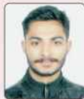
ਸਰੋਮਨ, ਬੀ.ਏ. ਭਾਗ ਦੂਜਾ, ਲੈਂਡ ਸਕੇਪ, ਜੇਨਲ ਯੂਥ ਫੈਸਟੀਵਲ (ਦੂਜਾ ਸਥਾਨ)