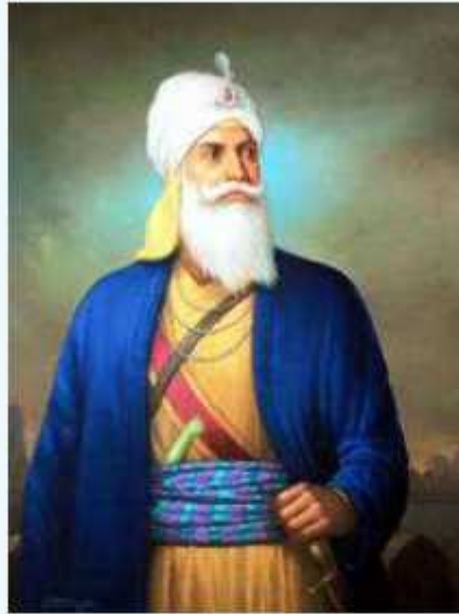
ਨਵਾਬ ਜੱਸਾ ਸਿੰਘ ਆਹਲੂਵਾਲੀਆ