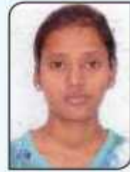
ਗੀਤਾ ਕਲਾਸ ਥੀ ਏ. ਸੰਸਕਰ ਛੇਵਾਂ ਗੁਰੂ ਨਾਨਕ ਦੇਵ ਯੂਨੀਵਰਸਿਟੀ ਦੀ ਮੈਰਿਟ ਲਿਸਟ ਵਿੱਚ 31ਵਾਂ ਸਥਾਨ ਪ੍ਰਾਪਤ ਕੀਤਾ