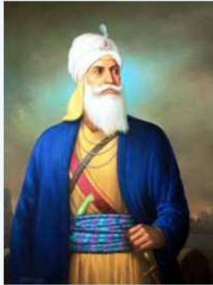
ਨਵਾਬ ਜੱਸਾ ਸਿੰਘ ਆਹਲੂਵਾਲੀਆ