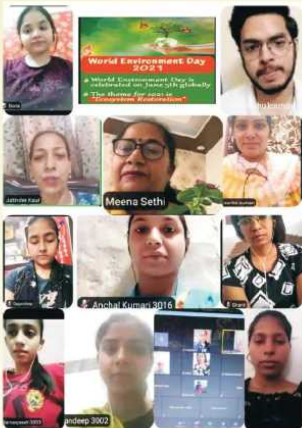
ਕਾਲਜ ਦੇ ਸਾਇੰਸ ਵਿਭਾਗ ਵੱਲੋਂ ਵਿਸ਼ਵ ਵਾਤਾਵਰਨ ਦਿਵਸ ਮੌਕੇ “ਈਕੋਸਿਸਟਮ ਰੀਸਟੋਰੇਸ਼ਨ” ਵਿਸ਼ੇ ਉੱਤੇ ਵੈਬੀਨਾਰ ਕਰਵਾਇਆ ਗਿਆ।