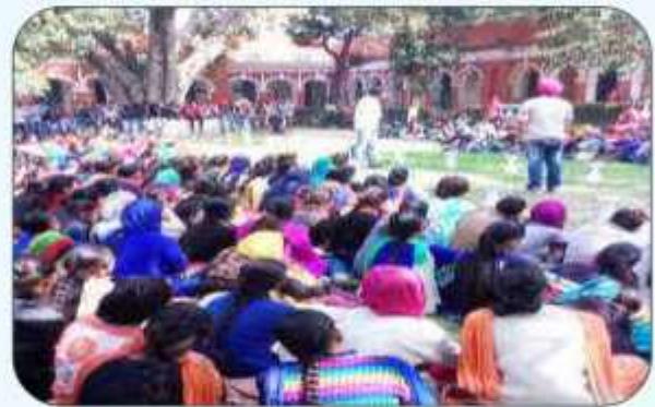
ਕਾਲਜ ਵਿੱਚ ਪੰਜਾਬੀ ਯੂਨੀਵਰਸਿਟੀ ਪਟਿਆਲਾ ਦੇ ਚੌਢ ਆਰਟ ਗਰੁੱਪ ਦੇ ਕਲਾਕਾਰ ਨੁੱਕਲ ਨਾਟਕ "ਵਹਿਰੀ" ਪੇਸ਼ ਕਰਦੇ ਹੋਏ