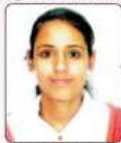
ਨਿਕਾ, ਐਮ.ਕਾਮ. (ਭਾਗ ਪਹਿਲਾ), ਕੁਇਜ਼, ਜੇਨਲ ਯੂਥ ਫੈਸਟੀਵਲ (ਪਹਿਲਾ ਸਥਾਨ)